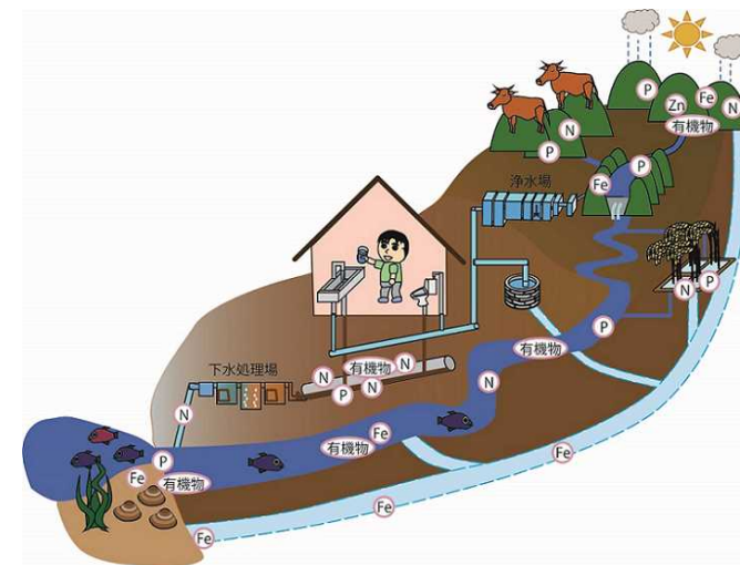
Figure 1 Environmental behaviour of nutritional materials

Biologically essential elements and organic matters, which travel in aquatic environments, are eluted from forests and cultivation areas and go into coastal area throughout river and ground waters (Figure 1). I am investigating their behaviours in order to clarify how land management conditions and seasonal fluctuation in the upper stream contribute to bio-productivity in down stream (Figure 2). All organisms requires nutrients for their growth, and amount of nutrients are one of the major factors determining biological abundance. Thus, harmful species can bloom when excess amount of nutrients come into an aquatic area, or in another case, decreased supply of nutrients can cause depressed bio-productivity. Therefore, it is important to anage river basin properly with understanding the behavior of nutrients in upper and down stream areas.